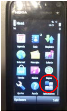
a) Triar "aplicaciones"